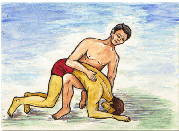
Удаление воды из дыхательных путей утопавшего.